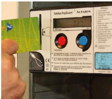
Compteur à budget électricité

Si votre ancien logement n'était pas équipé d'un compteur à budget, vous devez informer le plus rapidement possible votre fournisseur et votre gestionnaire de réseau qu'un compteur à budget est installé dans votre nouveau logement. Votre gestionnaire de réseau désactivera le compteur à budget afin que le compteur fonctionne à nouveau comme un compteur ordinaire.