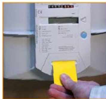
Compteur à budget gaz